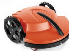
D tondeuse robot