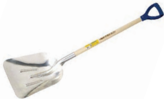
A le grattoir à neige