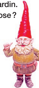
nain de jardin