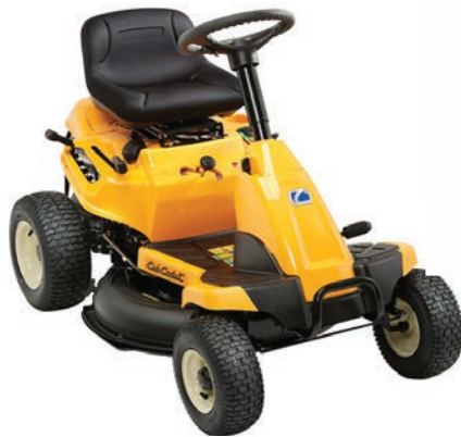
C tondeuse autoportée