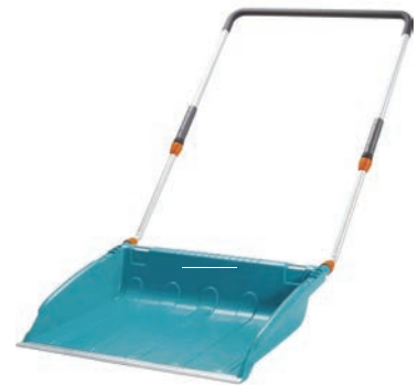
C le traîneau à neige

3 Qu'ont en commun les chaussettes (les bas), la tuque, le foulard et les mitaines ?