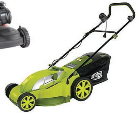
E tondeuse électrique