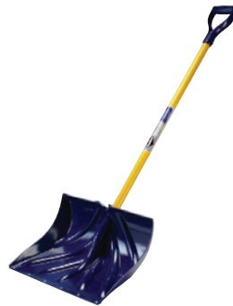
B la pelle à neige